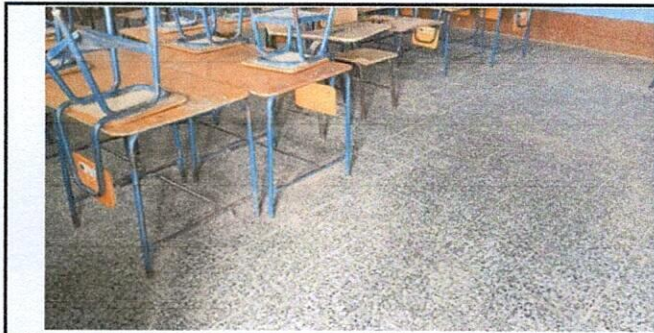
Foto 1: Mejoramiento de piso a tipo cerámico o granito en todos los ambientes del establecimiento.