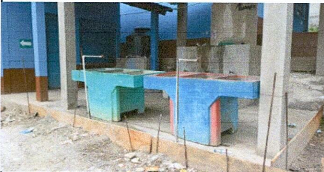
Foto 5: Con el remanente se colocó 16 metros cuadrados de piso de concreto en galera del edificio escolar.

Observación: Si es necesario se pueden agregar hojas adicionales y actualizar el número de hojas.