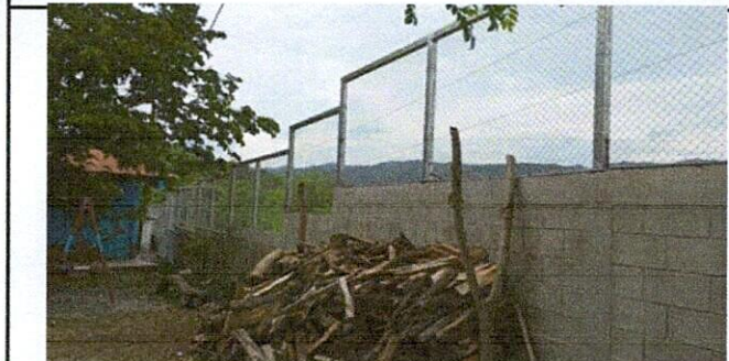
Foto 4: Mejoramiento instalación de malla metálica sobre muro perimetral.